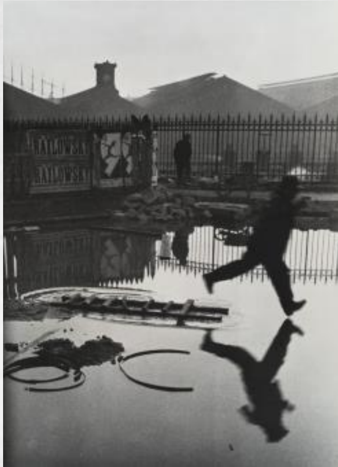
Detrás de Gare St. Lazare. Henri Cartier-Bresson, 1932