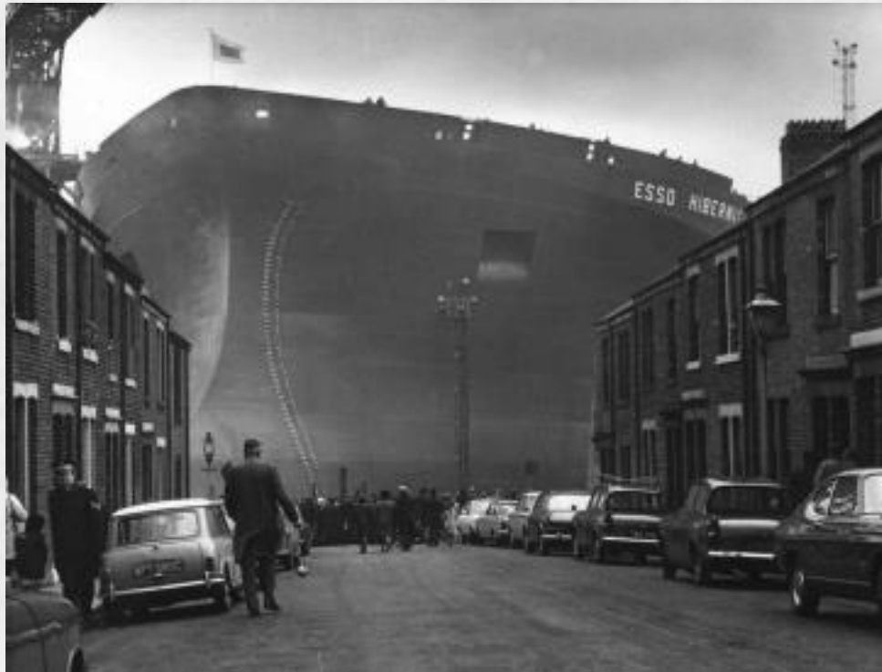
El petrolero Esso Hibernia en construcción en Wallsend, Reino Unido, 1970

Miedo, intriga. Inglaterra sometida al terror de una catástrofe. Todo el mundo admirando al gran armatoste que se planta ante todo.